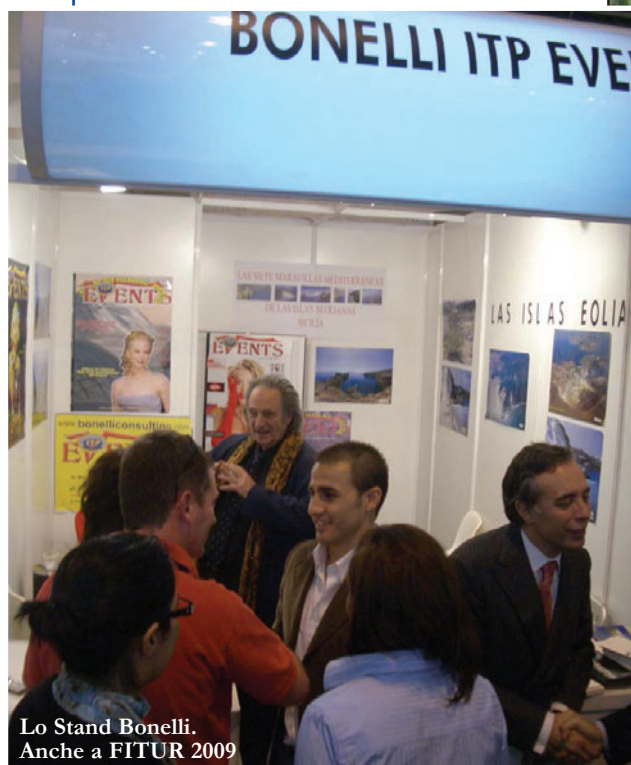
Lo Stand Bonelli. Anche a FITUR 2009

hanno segnato un record storico di partecipazione: 13.530 imprese in rappresentanza di 170 Paesi o regioni, 255.817 visitatori, di cui 157.300 professionisti e 8.000 giornalisti accreditati. Sono cifre che la rendono la seconda Fiera del Turismo in Europa per numero di espositori e di visitatori e che l'edizione di quest'anno vuole non solo mantenere ma addirittura incrementare, puntando su nuove linee strategiche e forti del fatto che fino a oggi gli agenti turistici e i professionisti del settore della scorsa edizione hanno già confermato la propria presenza.