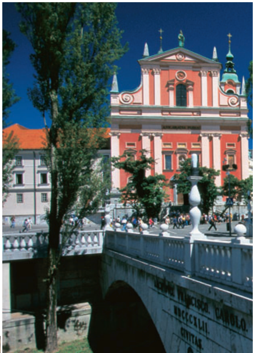
Sopra: Ljubljana: triplice ponte, archivio STO, foto A. Fevzer.

Inventiva, fatica ed amore gli ingredienti di questa cucina, i cui piatti più caratteristici sono: il brodetto, i datteri alla triestina, gli scampi alla buzzara, il risot-