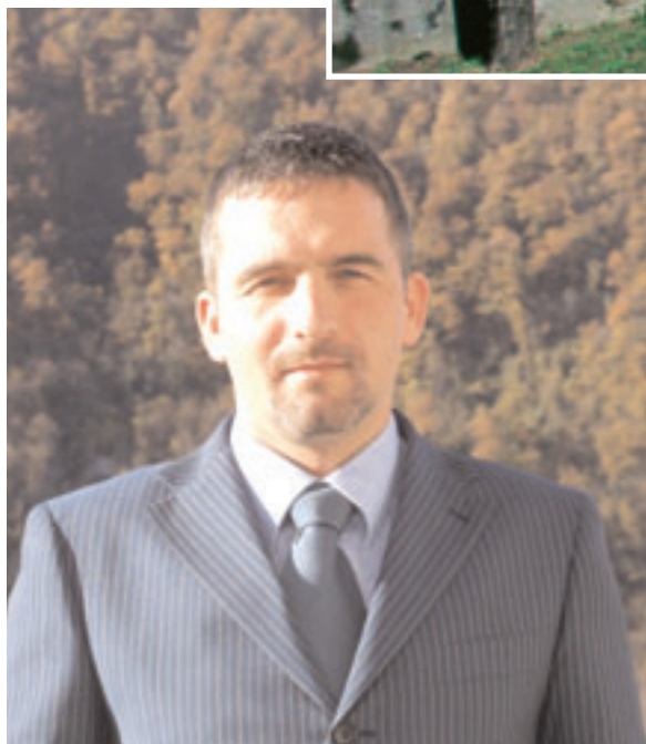
Accanto: Gorazd Skrt, Direttore Ufficio Turismo Sloveno di Milano